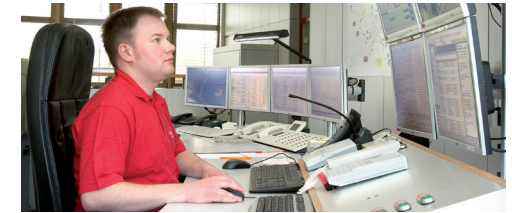
Netzleitstelle Stadtwerke Hameln

Die monatliche Grundgebühr beträgt 35 €. Für die Installation des HausNotruf-Gerätes wird Ihnen einmalig eine Pauschale in Höhe von 60 € bis 80 €, je nach Örtlichkeit, in Rechnung gestellt. Bei Genehmigung einer Pflegestufe übernimmt die Krankenkasse monatlich bis zu 18,36 €. Unter bestimmten Voraussetzungen übernimmt das Sozialamt die Kosten. Die Stadtwerke Hameln stellen Kostenübernahmeanträge direkt bei der Pflegekasse.